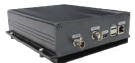
取付後のイメージ